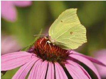
Zonnehoed is een echte zonaanbidder

klimhortensia, vingerhoedskruid, eikvaren en elfenbloem.