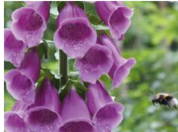
Vingerhoedskruid houdt van schaduw