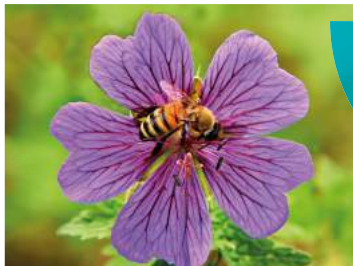
De geranium is een halfschaduwplant